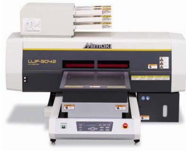
UJF-3042 UV PRINTER

Imprimanta A3 ce foloseste cerneala UV (cyan, magenta, yellow, black, white si lac UV ).