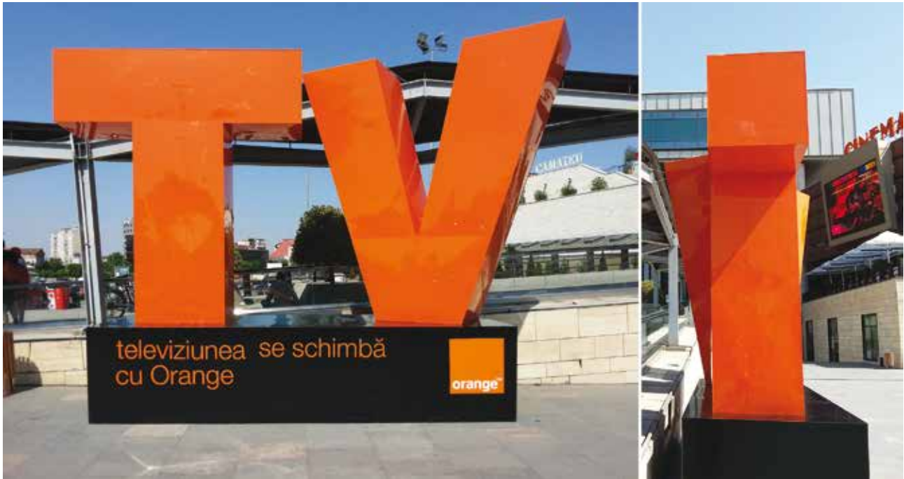
Proiect special TV Orange