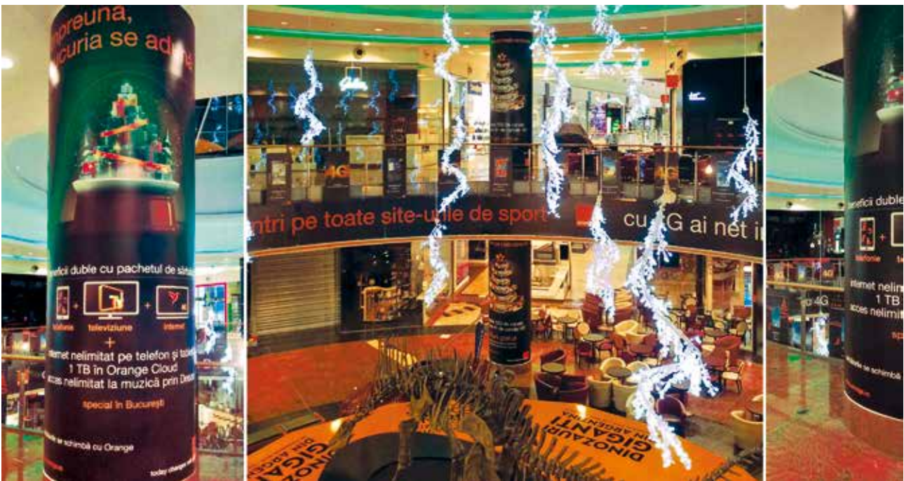
Signalistică Mall Băneasa - Orange