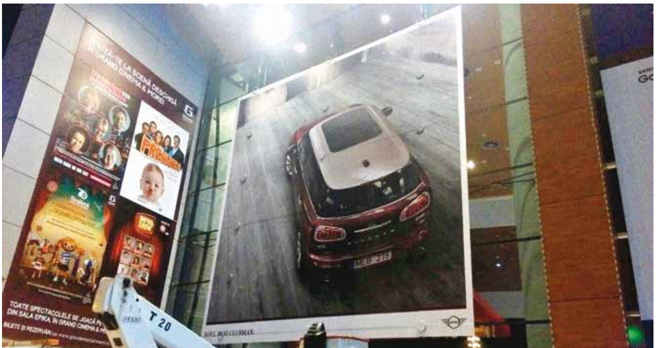
Decorare Mall Băneasa Mini Cooper