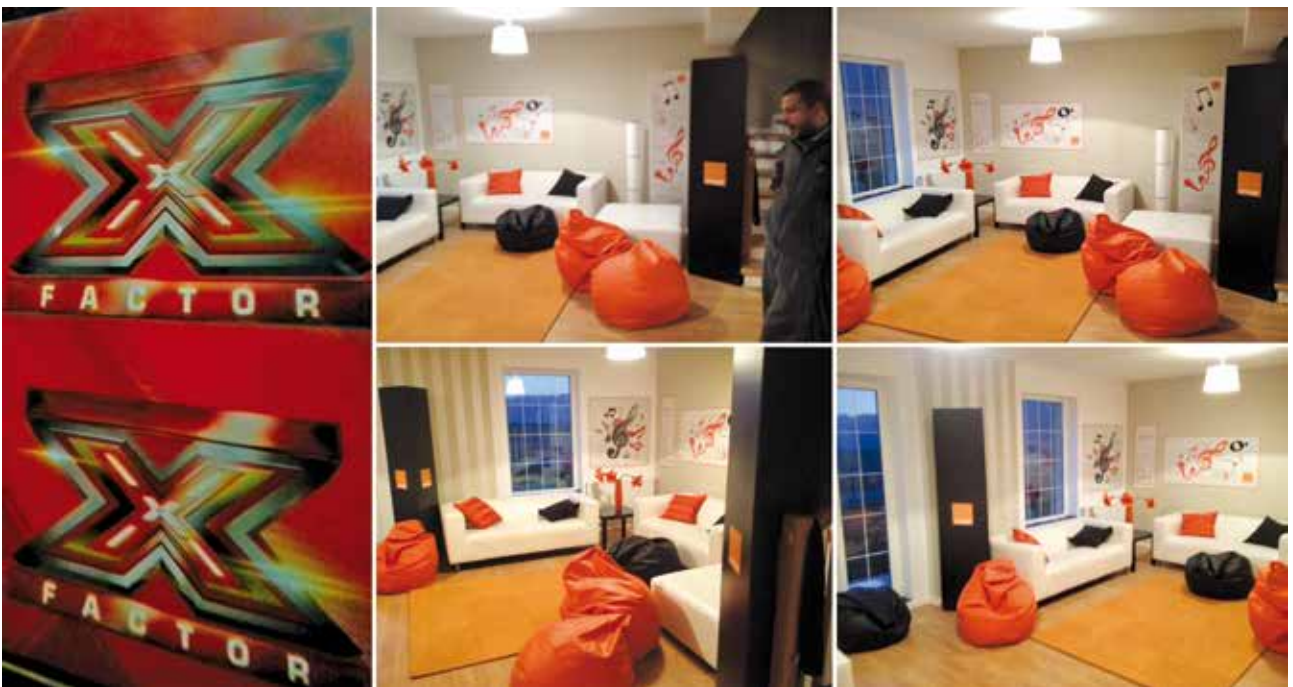
Amenajare platou X Factor