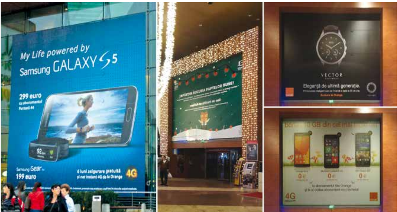
Decorare food court Mall Băneasa