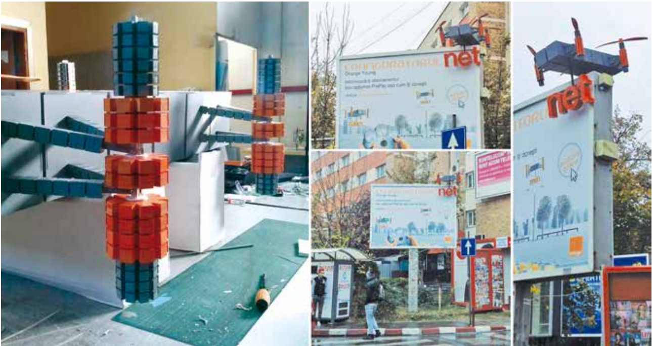
Proiect special Drone Orange