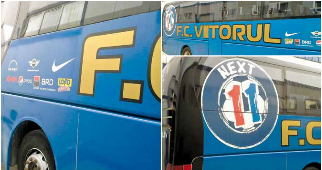
Colantare autocar Academia Hagi