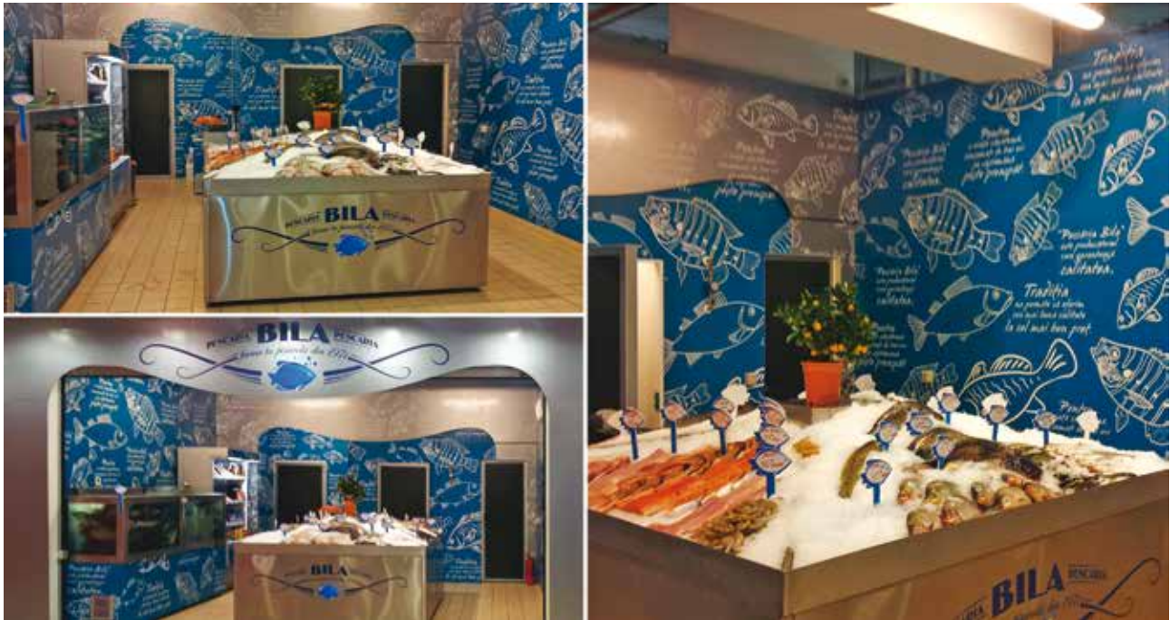
Amenajare magazin Pescařia Bila