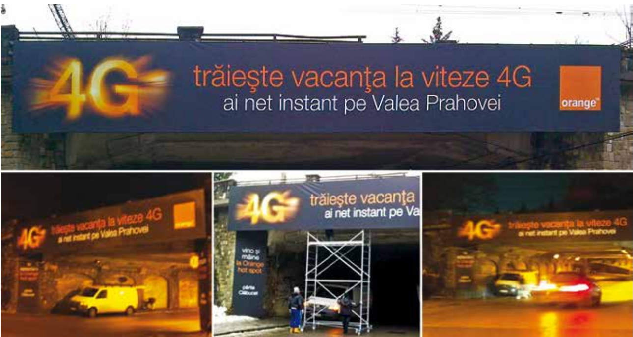
Signalistică Pod Predeal Orange