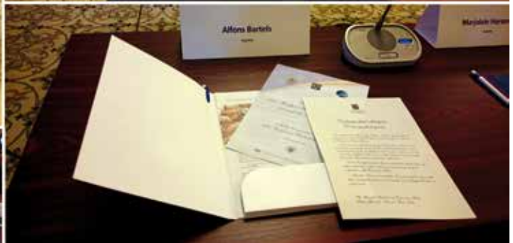
Materiale diverse Conferință Poliția Rutieră