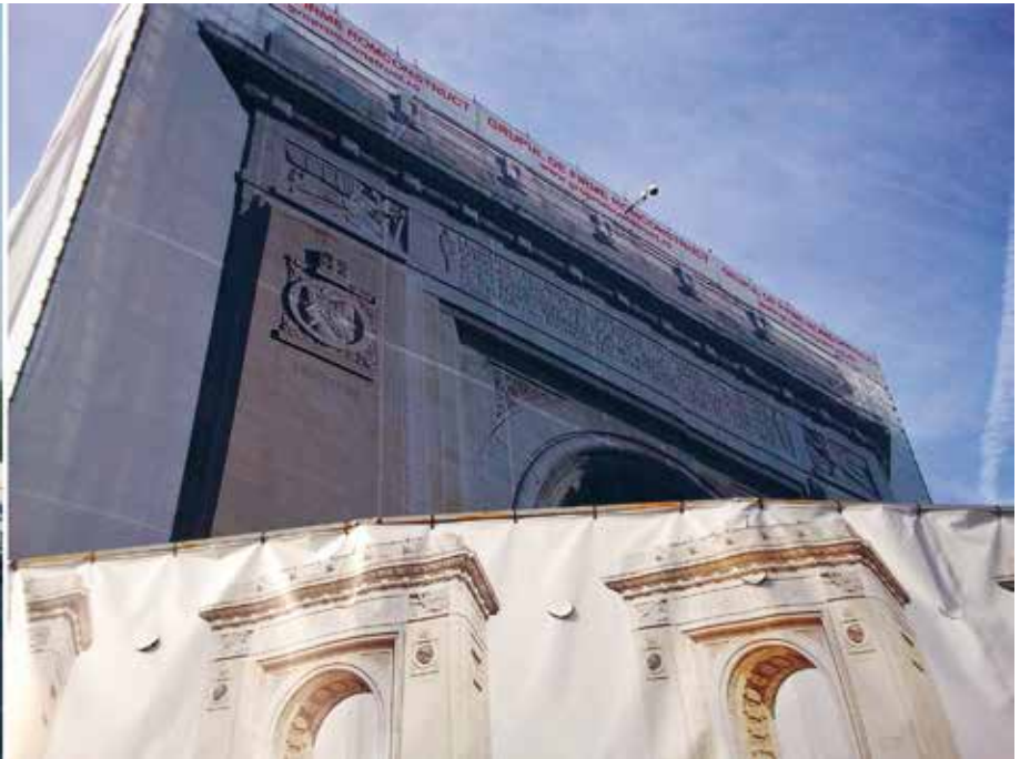
Mesh Arcul de Triumf