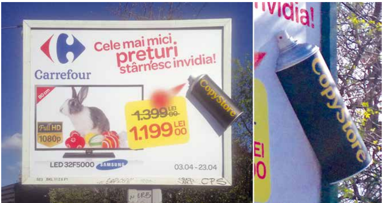
Proiect special Carrefour