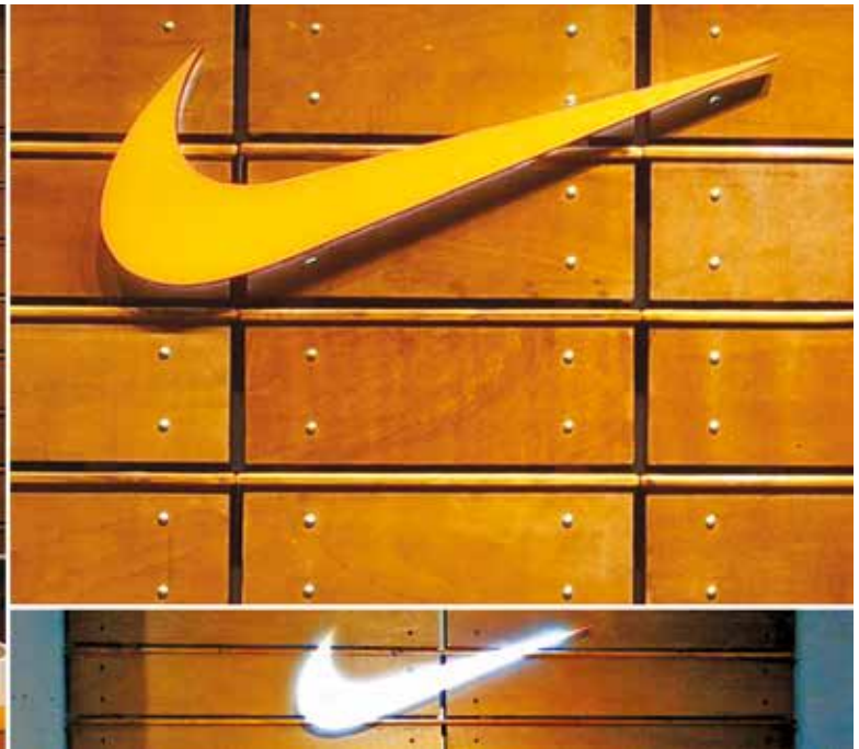
Amenajare spațiu comercial Nike