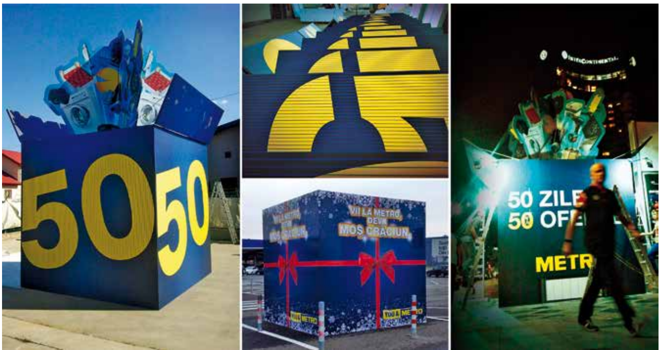
Proiect special Metro