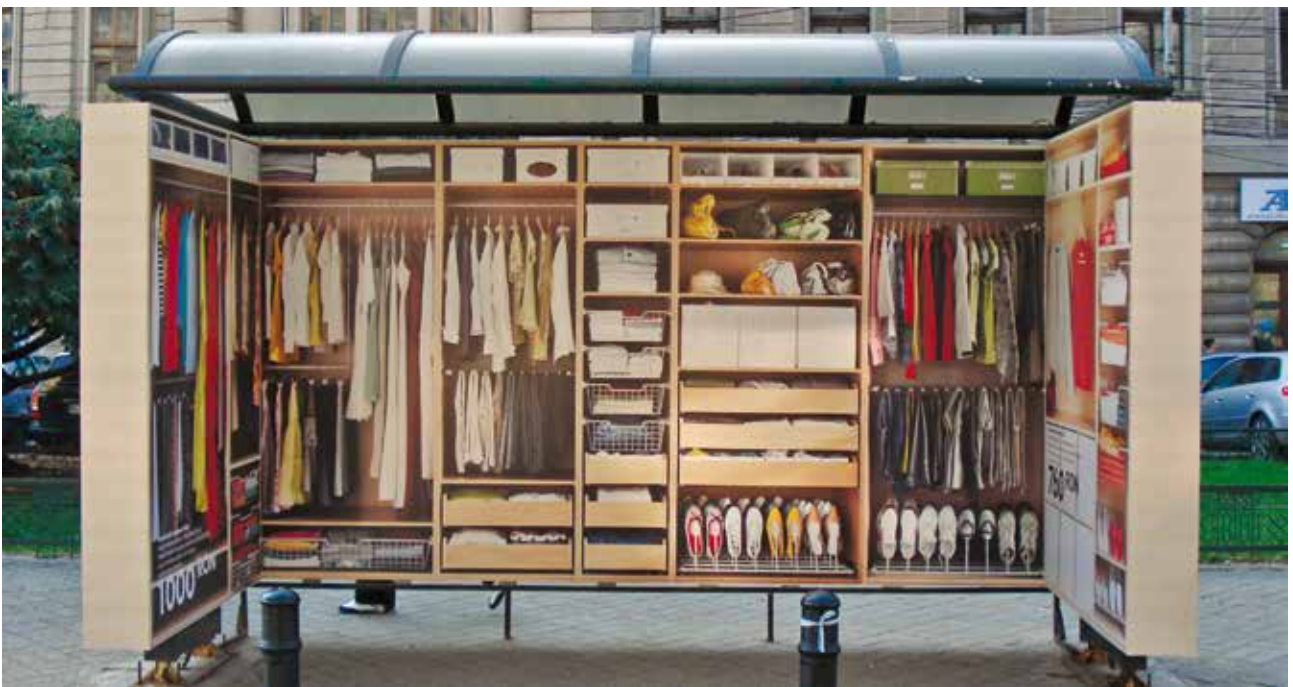
Proiect special stație BUS Ikea