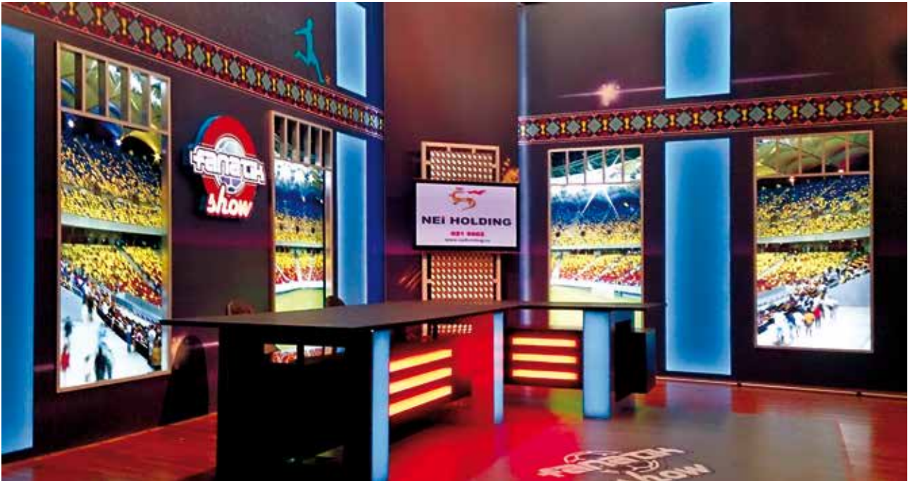
Amenajare studio Fanatik Show