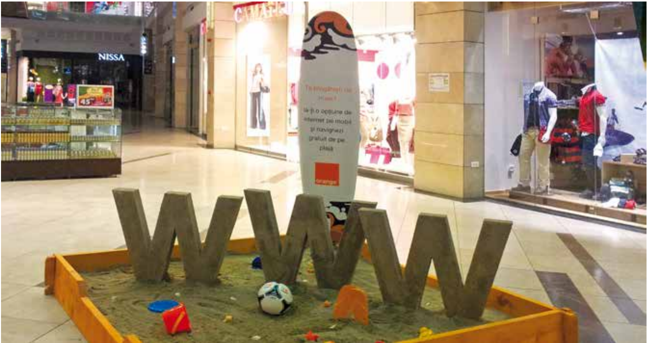
Proiect special Orange