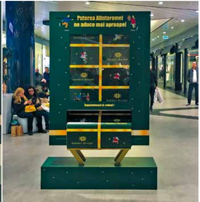
Proiect Jacobs Promenada