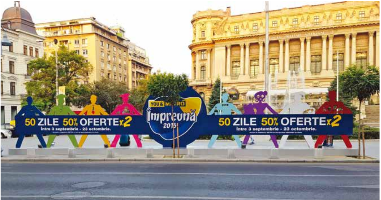
Proiect special Metro