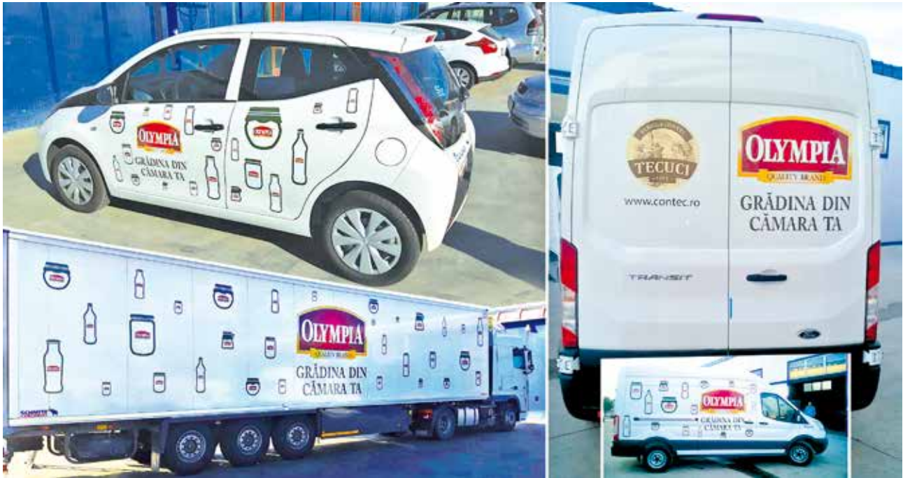
Colantare flotă mașini Olymبيا