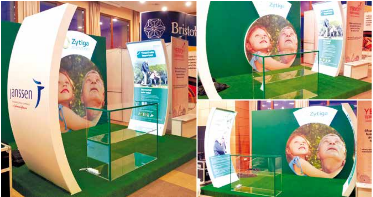
Amenajare stand Zytiga