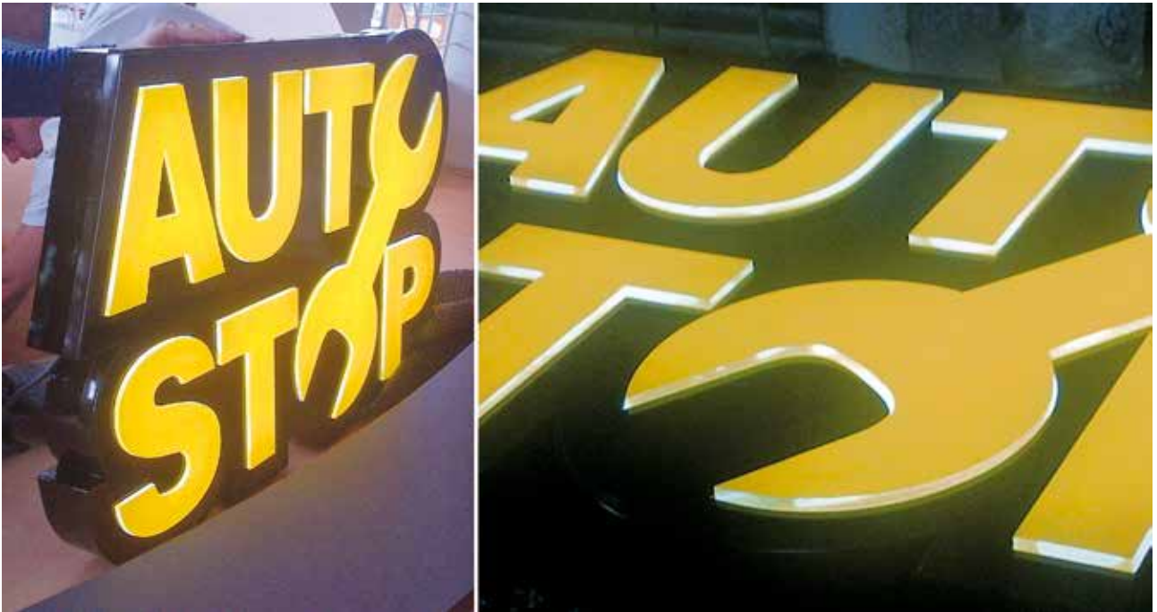
Signalistică Auto Stop