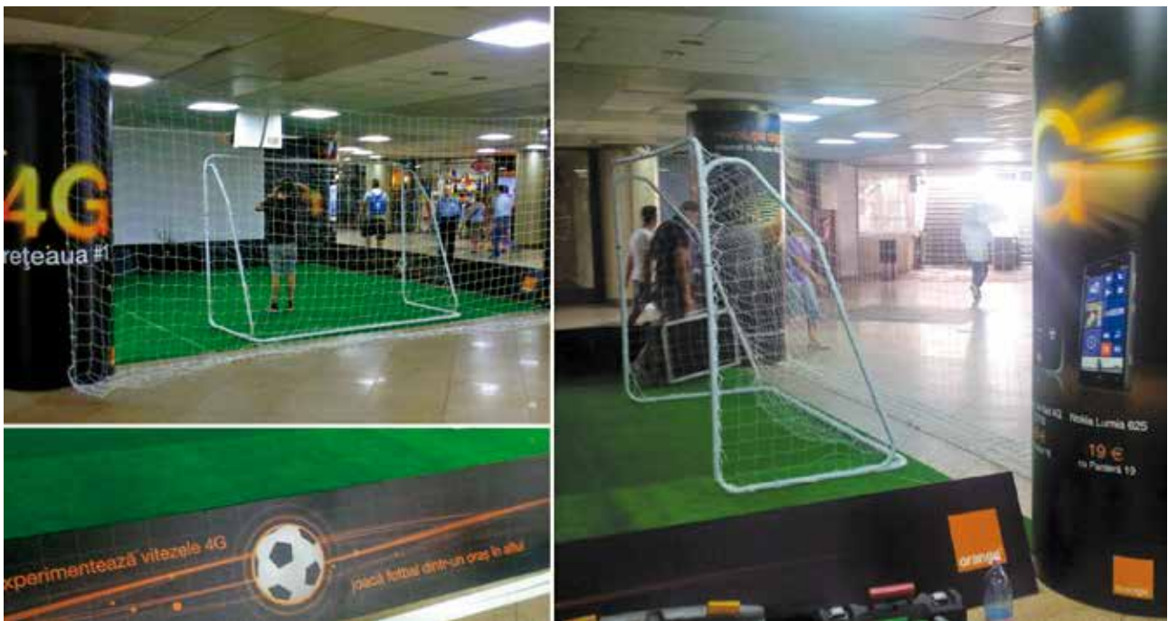
Proiect special Football Pasaj Universitate