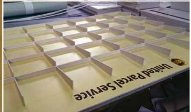
Proiect special UPS