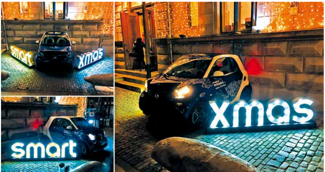
Proiect special Smart Xmas